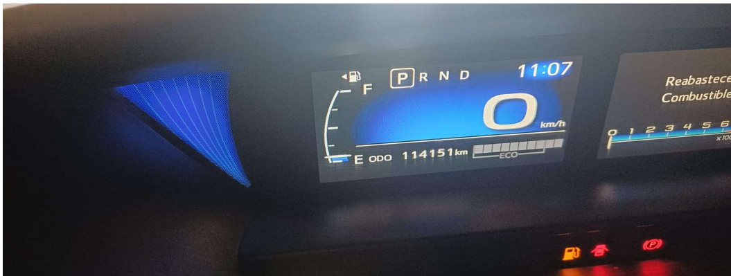
REGISTRO FOTOGRAFICO – FORD KUGA